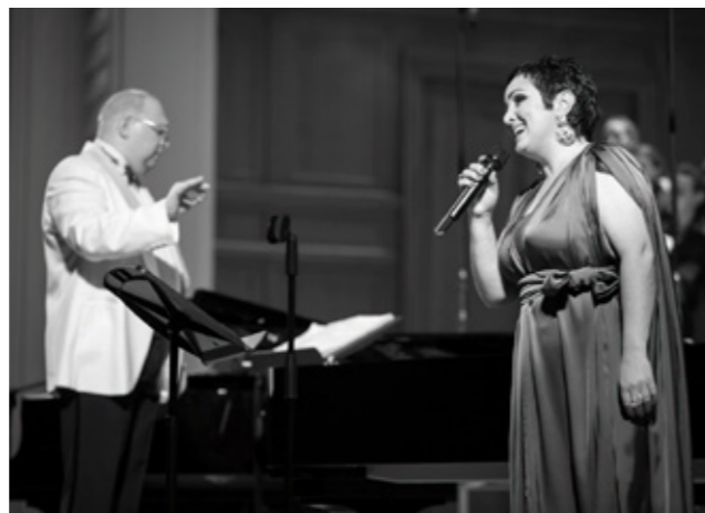
«Ленинград и Победа» БЗК, 10 мая 2015 года