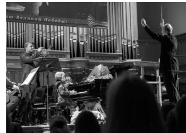
«Авторское отделение Александры Пахмутовой» БЗК, 14 мая 2015 года