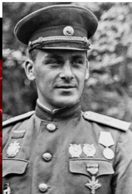
Глеб Владимирович Бакланов

25 апреля 1945 года в самом центре Германии, на Эльбе, у городка Торгау 34 Гвардейский корпус генерала Бакланова встретился с войсками наших союзников. Отец — тридцатилетний генерал, один из самых молодых генералов нашей армии — вспоминал, что накануне он весь день провел на колесах, предупреждая войска о возможной встрече. А вернувшись, узнал, что к нему в корпус прибыли по этому случаю корреспонденты столичной газеты «Красной Звезды» — Константин Симонов и Александр Кривицкий.