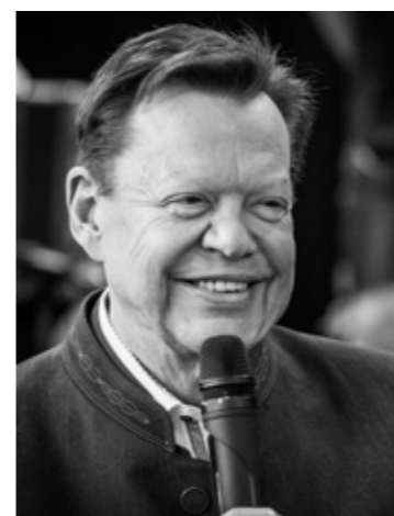
ПРЕЗИДЕНТ МЕЖДУНАРОДНОГО ХОРОВОГО ОБЩЕСТВА «ИНТЕРКУЛЬТУРА» (ГЕРМАНИЯ) ГЮНТЕР ТИЧ

Будьте все здоровы и до скорой встречи на наших совместных концертах!