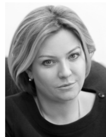
МИНИСТР КУЛЬТУРЫ РОССИЙСКОЙ ФЕДЕРАЦИИ О.Б. ЛЮБИМОВА