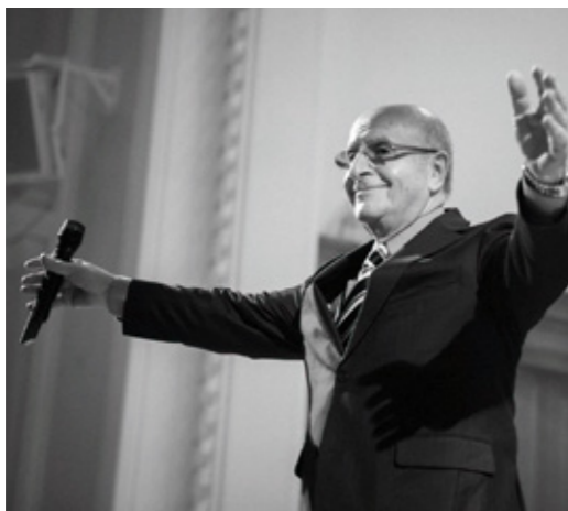
Народный артист России Яков Дубравин

В эфире проект «Ленинград и Победа». День Победы был бы невозможен без героизма ленинградцев, отстоявших свой город в блокадной осаде. Несломленная воля и беззаветное мужество ленинградцев вдохновили миллионы людей на самоотверженную борьбу. Город выстоял — и вся страна поверила в близость Победы. Состоявшийся в 2015 году в Большом зале консерватории проект «Ленинград и Победа» Народного артиста России Якова Дубравина, чьи песни о городе на Неве обрели всероссийскую популярность, был удостоен Премии Правительства Санкт-Петербурга. Вместе с ним в этот вечер на сцене Женский хор Музыкального училища имени Римского-Корсакова под управлением Сергея Екимова, за роялем — автор, Яков Дубравин, с которыми совместно музицирует эстрадная певица зашкаливающего темперамента и потрясающего лирического дарования, участница проекта «Голос» Этери Бериашвили.