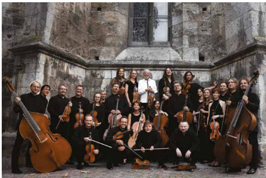
Камерный оркестр Гидона Кремера Kremerata Baltika