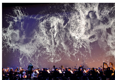
Заккрытие фестиваля (3 апреля)

1 апреля под руководством Пьера Карло Орицио (Италия) слушателей Большого зала порадовал Российский национальный оркестр. Насыщенная программа включала только русскую классику. Ее открыла увертюра-фантазия П.И.Чайковского «Ромео и Джульетта», прозвучавшая романтично и страстно. Затем художественный руководитель РНО Михаил Плетнев выступил в роли солиста, исполнив Концерт для фортепиано с оркестром А.Н.Скрябина. А завершила вечер «Шехеразада» Н.А.Римского-Корсакова, сыгранная эффектно и колоритно.