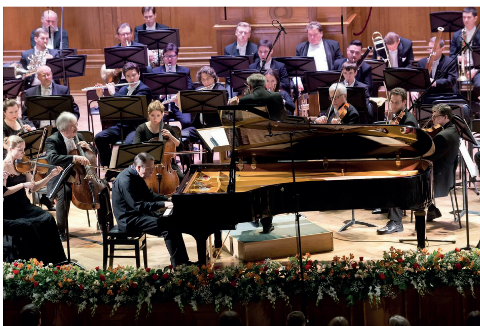
Михаил Плетнев (1 апреля)