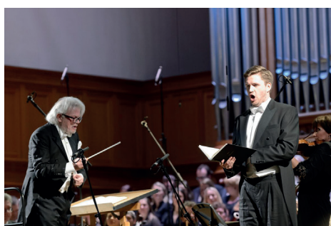
Исполнение «Страстей по Матфею» (2 апреля)