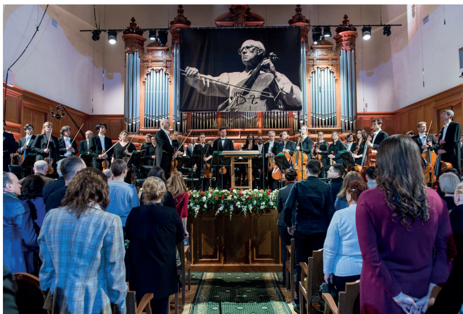
Открытие фестиваля (27 марта)

Это был стильный «австрийский» вечер – звучала музыка Гайдна и Моцарта. Программу открыла «Маленькая ночная серенада» Моцарта, затем в исполнении Рудольфа Бухбиндера прозвучали Концерт №9 Es-dur для фортепиано с оркестром Моцарта и Концерт D-dur для фортепиано с оркестром Гайдна. Во втором отделении публика также услышала Симфонию №29 Моцарта.