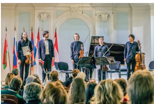
I премия – фортепианный квинтет МГК

Состязания камерных ансамблей обладают особой спецификой. Участники должны проявить не столько свое индивидуальное дарование (оно подразумевается само собой), сколько умение находиться в диалоге. Именно способность к сотворчеству, сопереживанию, сочувствию, соучастию и становится определяющей.