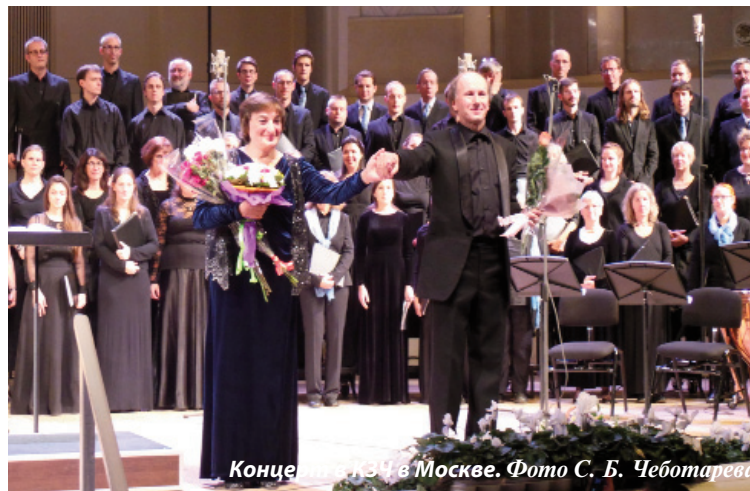
Концерт в Москве.

Беспрецедентным событием стала международная акция, которая прошла осенью этого года. Память о событиях Первой мировой войны, запечатленных Кастальским, послужила поводом к объединению трех творческих коллективов – Мужского камерного хора «Кастальский» под