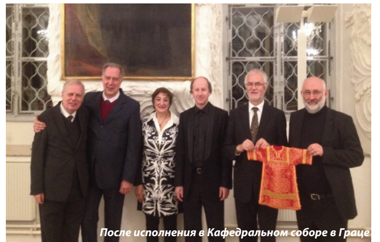
После исполнения в Кафедральном соборе в Граце