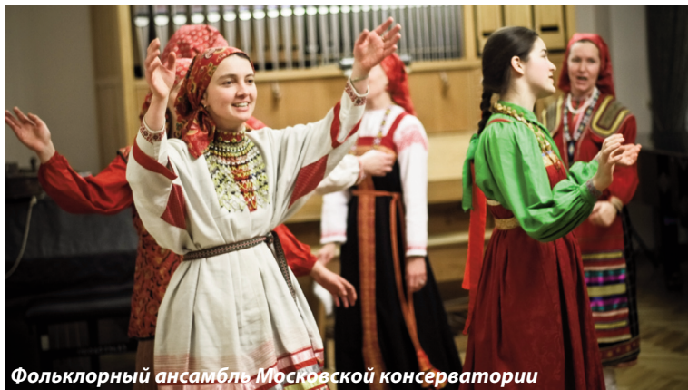
Фольклорный ансамбль Московской консерватории

Наиболее очевидная связь Человека и Природы была про-