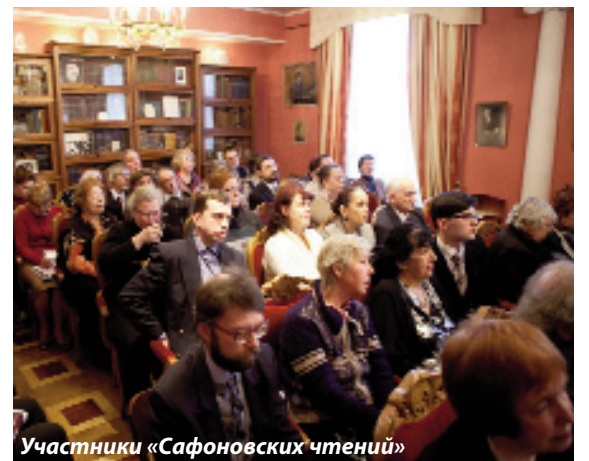
Участники «Сафоновских чтений»