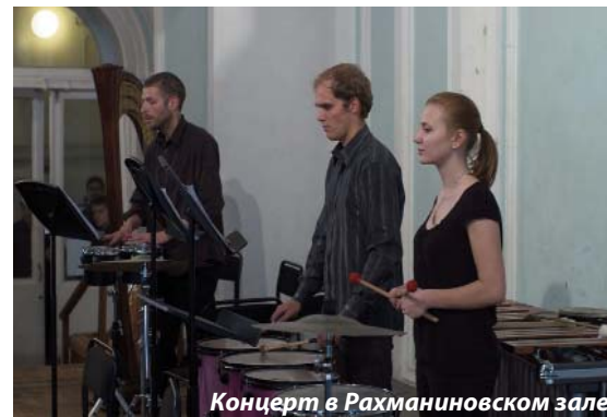
Концерт в Рахманиновском зале

Двумя днями раньше в Рахманиновском зале, также в рамках Года Германии в России, был запущен проект «Звуковой поток». Концерт