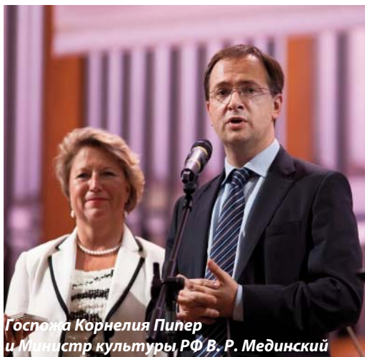
Госпожа Корнелия Пипер и Министр культуры РФ В. Р. Мединский

Большой зал был заполнен до отказа. Наряду с «высокими» гостями и руководителями проекта в консерваторию пришли и всегдашние меломаны – к счастью, места хватило на всех. Во вступительном слове Государственный