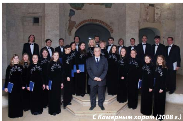
С Камерным хором (2008 г.)

125009, Москва, ул. Б. Никитская, 13 e-mail: newspapers@mosconsrv.ru Интернет: gm.mosconsrv.ru Свидетельство о регистрации СМИ: ПИ № ФС77-37912 ПРИ ПЕРЕПЕЧАТКЕ ССЫЛКА НА ГАЗЕТУ ОБЯЗАТЕЛЬНА