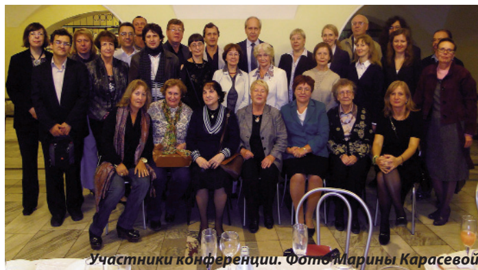
Участники конференции.