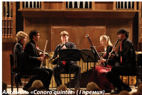
Ансамбль «Conoro quintet» (I премия)

Спонсорами конкурса в разное время являлись английская топливная компания «BP», производители музыкальных инструментов «Ямаха», «Пюхнер», «Лоре». Но основную тяжесть в организации и проведении конкурса взяла на себя Московская консерватория, предоставившая, помимо залов, финансирование из собственных средств. Большую организационную работу провел Концертный отдел МГК.