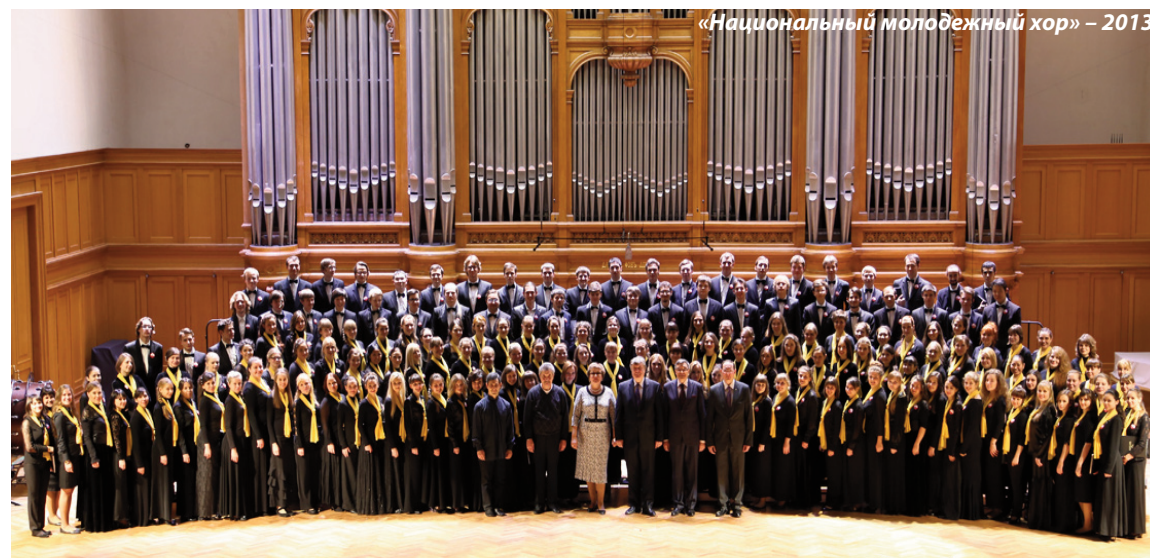
«Национальный молодежный хор» – 2013

Сочинения наших современников – Щедрина, Баркаускаса, Пахмутовой – представил А. Соловьев, который завершил свой блок мировой премьерой партитуры «Лиссабон» для солистов, хора и ударных молодого