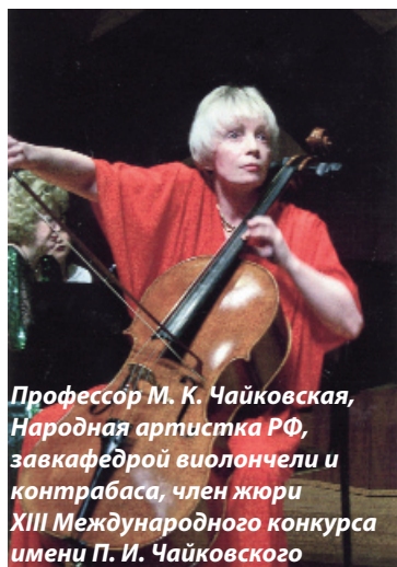
Профессор М. К. Чайковская, Народная артистка РФ, завкафедрой виолончели и контрабаса, член жюри XIII Международного конкурса имени П. И. Чайковского

Продолжение. Начало в «РМ» 2011, № 9; 2012 № 1 и № 2.