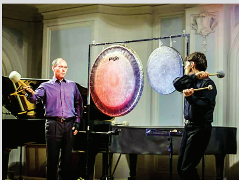
Концерт-закрытие. РЗК, 1 июня 2017 г.

– Основной принцип Штокхаузена – каждое последующее исполнение должно быть лучше предыдущего. Прошла тысяча репетиций, прежде чем мы смогли довести все до уровня того, что можно было показывать на сцене. Перед этим в 2009 году мы выступили на конкурсе с «INORI» и заняли первое место. При исполнении некоторых сочинений композитора музыкант находится как бы в другом