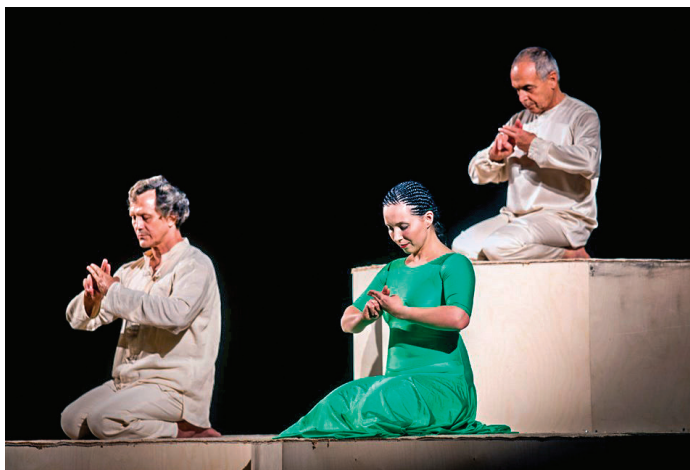
«INORI» БЗК, 28 мая 2017 г.