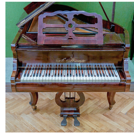
«Энгармонический клавицин» Одоевского