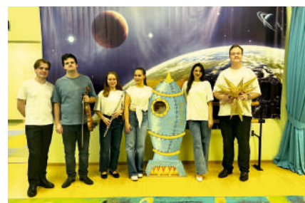
После концерта «Вперед, к звездам!»

Художественный руководитель и главный редактор: профессор Т.А. Курышева