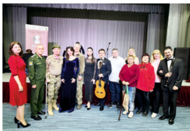
В санатории-профилактории «Сосновый бор»