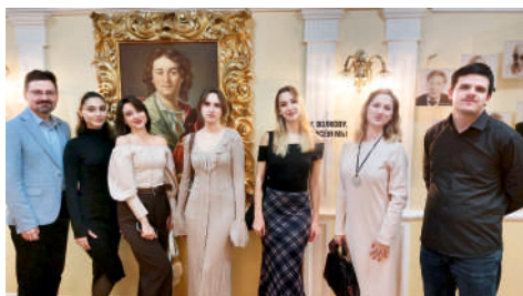
На концерте-открытии «Коган-Фестиваля» в театре им. Ф. Волкова