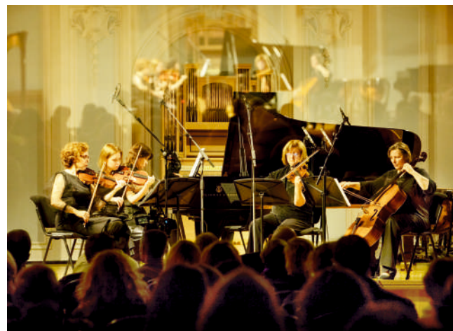
Ансамбль «Студия новой музыки»