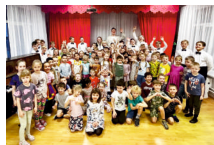
«Песни поздней осени». Младший хор училища имени А.В. Свешникова