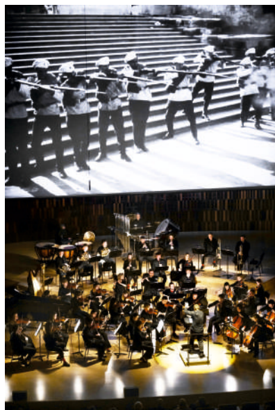
Показ фильма в концертном зале Зарядье