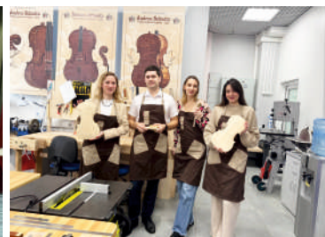
В школе скрипичного мастерства Андрея Шюдтца